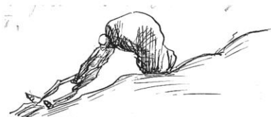
Blyertsteckning av Harriet Löwenhjelm, i dagboken den 2 oktober 1911.

Hittade en teckning av Signe Lund-Aspenström som starkt påminde om Harriet Löwenhjelm's teckningar i dagböckerna. Med sin humoristiska framtoning känns nästan Lund-Aspenström's teckning mer Löwenhjelm'sk än Löwenhjelm's egen Sisyfosliknande gestalt, eller vad tycker du?